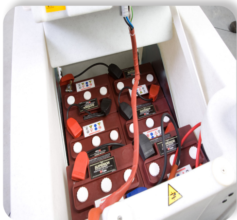
batterie al gel o acido con grande autonomia Lead acid or gel batteries with great autonomy