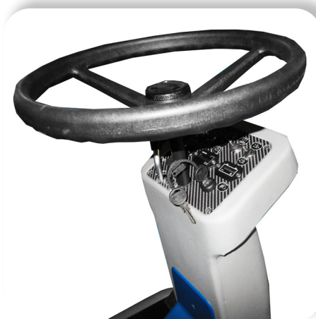
comandi semplici e intuitivi simple and intuitive controls