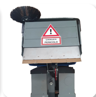
scarico alto per facilitare il lavoro dumping height